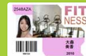
Cartes de membres