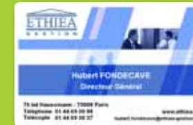
Cartes de visite